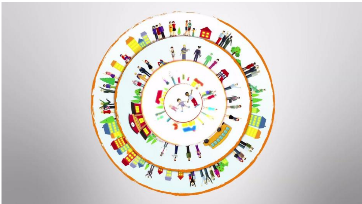
Programme d'activités, printemps 2018, CPE Trois Petits Points

On dit souvent qu'il faut tout un village pour élever un enfant. Les publicités à la télévision de Naître et Grandir sont bien efficaces pour le démontrer. Le CPE Trois Petits Points se veut donc un habitant influent dans ce village qui ne veut que le bien-être et l'épanouissement de l'enfant. Par le biais de différents partenaires mentionnés dans la programmation annuelle et la plateforme pédagogique, le cpe réussit à accomplir sa mission.